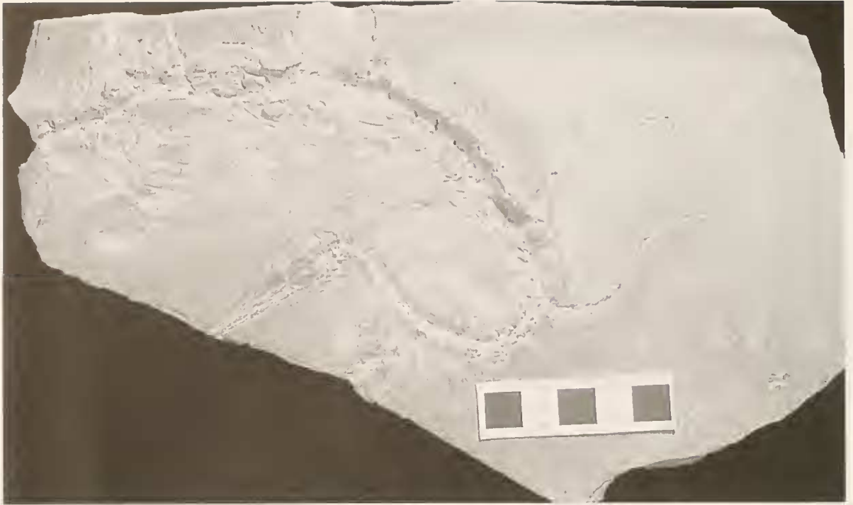
Abb. 5: Brazilosaurus sanpauloensis , BSP 1965 I 130. Maßstab = 50 mm.

überlappend. Posteriorer Cervikalbereich stark gebogen. Gastralrippenkorb im gesamten Thorax ausgebildet. Thorakalrippen nicht pachyostotisch. Carpus mit 2 Carpalia proximalia, einem großen Centrale und 4 Carpalia distalia. Letztere gelenken mit Metacarpale I–IV. Phalangenformel (Hand): 2.3.4.5.4.